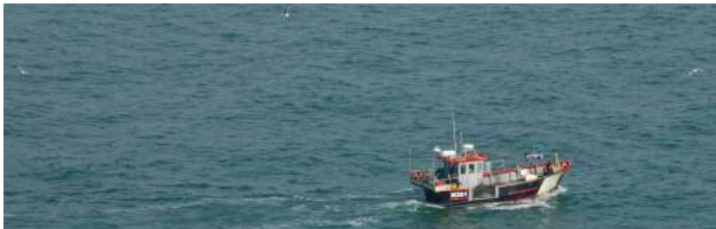
Cwch pysgota (potio) ger Pencaer