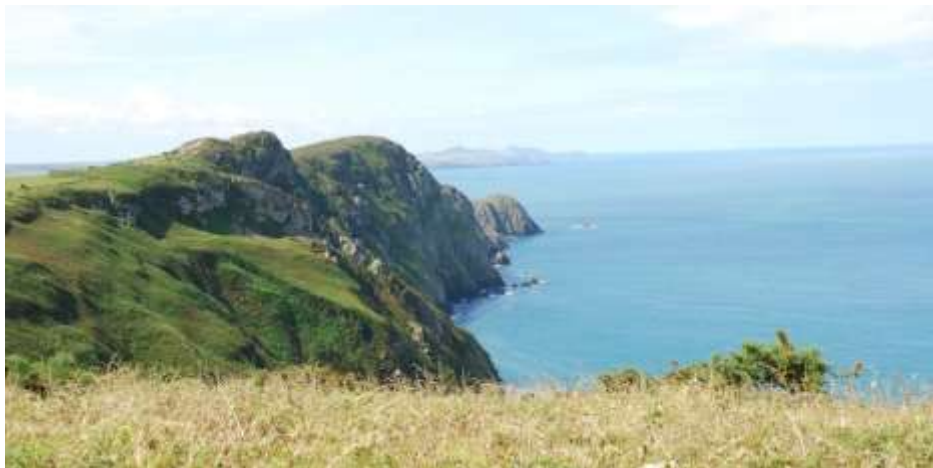
Clogwyni uchel ym Mhenbwchdy

- 181mAOD o uchder – gabro Penrhyn Tyddewi, Garn Fawr - 213mAOD o uchder a Phenbiri). Mae ynysigau y Bishops and Clerks yn igneaidd yn bennaf, ac yn cynrychioli parhad y patrwm hyn i'r ardaloedd oddiar yr arfordir. Canolwyd gweithgaredd folcanig lleol ar Ynys Sgomer. Ar arfordir penrhyn Marloes mae'r creigiau hyn i'w gweld ar raddfa fawr, tra bod eu parhad oddiar yr arfordir i'w weld yn ynysydd/ ynysigau Sgomer, Gwales a'r Smalls. Ffurfiwyd lleidfeini, calchfeini a thywodfeini'r cyfnod mewn moroedd bas ffosiliferws cynnes (braciopodau, cyrelau). Tua diwedd y cyfnod Silwraidd dangosir y trawsnewidiad o amodau morol i rai di-forol gan y newid i dyddodiad gwely-coch yr Hen Dywodfaen Coch (e.e. Pentir y Santes Ann - 46mAOD o uchder, Freshwater West gyda'i blatfform a naddwyd gan donnau, Freshwater East a Phentywyn). Mae hyn yn parhau i'r Ddefonaidd, a gynrychiolir gan dywodfeini coch a charreg laid a ffurfiwyd ar wastatir arfordirol, fflatiau llaid, morfeydd heli ac mewn afonydd plethog. Roedd planhigion cynnar, pysgod arfog ac amffibiaid yn byw yn yr amgylcheddau daearol hyn. Creodd gwrthdrawiad y cyfandiroedd blygiannau a ffawtiau sy'n amlwg iawn yng nghlogwyni gogledd Sir Benfro (e.e. Bae Abereiddi).