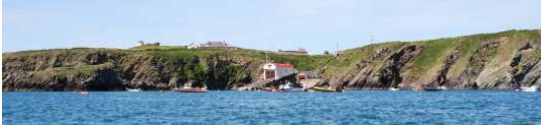
Porthstinan o Swnt Dewi