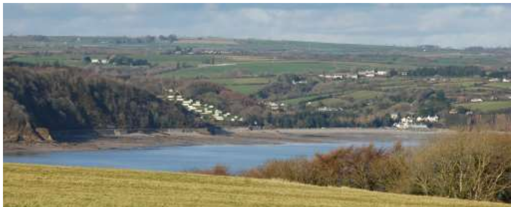
Carafannau yn Wiseman's Bridge

weithgareddau traeth cyffredinol sydd yn boblogaidd ar y traethau niferus glân, hyd at weithgareddau mwy egnïol megis syrffio barcud, dringo, plymio ac arforgampau, camp a ddyfeisiwyd yn yr ardal. Hefyd, pennir dwysedd y defnydd gan wyliau ysgol, yn ogystal â gan y tywydd.