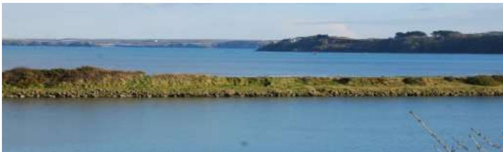
Lagŵn yn Dale