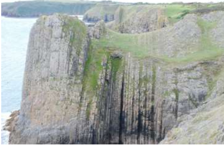
Clogwyni calchfaen carbonifferaidd: Craig Whitesheet