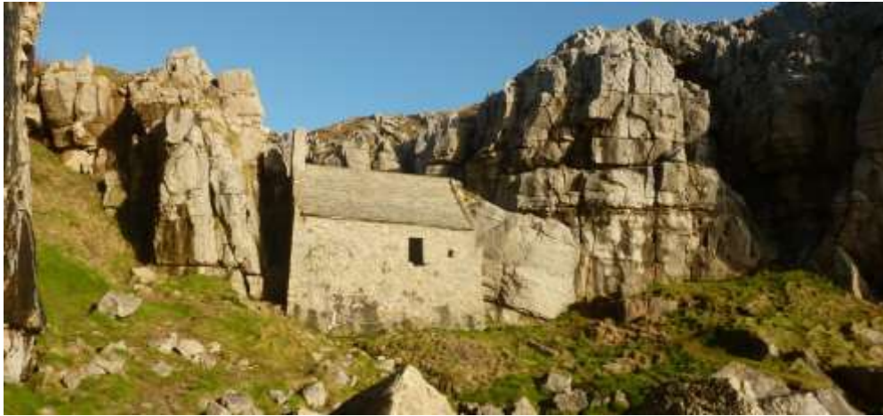
Capel St Gofan

marc gweithgaredd dynol fel caerau penrhyn_e.e.Castell Coch, safleoedd crefyddol e.e. capel Sant Gofan a gweithfeydd gadawedig e.e. Porthgain neu Abereiddi.