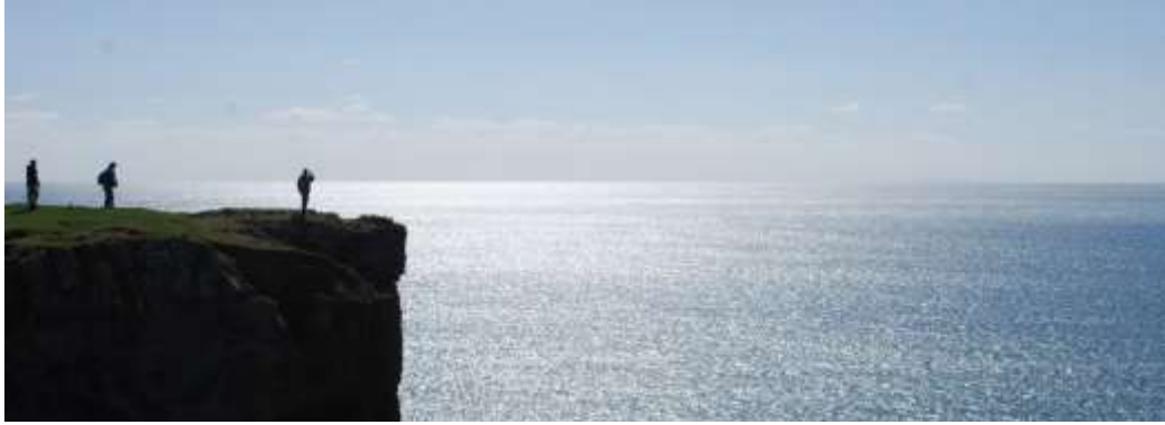
Pentir Stagbwll - golygfeydd panoramig