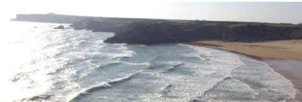
Tonnau yn Aber Llydan (De)