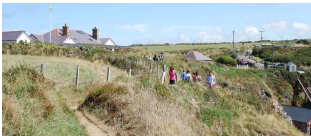
Llwybr yr arfordir ym Mhorthstinian - darn poblogaidd ohono