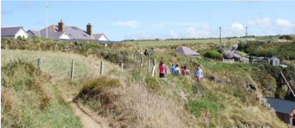
Llwybr yr arfordir ym Mhorthstinian - darn poblogaidd ohono

defnyddio Llwybr y Arfordir bib blwyddyn . Mae llwybr yr arfordir yn 300km o hyd, diolch i natur fylchog iawn a chymhleth yr arfordir. Mae rhannau penodol yn cael mwy o ddefnydd nag eraill - yn bennaf y rhai sy'n agos i'r 'potiau mêl', megis Dinbych-y-Pysgod a Bae Traeth Mawr ayyb. Gweithgaredd hamdden boblogaidd arall yw caiacio diolch i'r mynediad cymharol hawdd i'r dŵr. Ymysg llongau poblogaidd eraill rhestrir cychod modur a chychod hwylio bach sy'n hwylio o'r rhan fwyaf o'r traethau sy'n meddu ar llithrfa. Mae pysgota môr - o'r lan neu o gwch, sy'n gallu hwylio cryn dipyn o bellter o'r lan - hefyd yn boblogaidd.