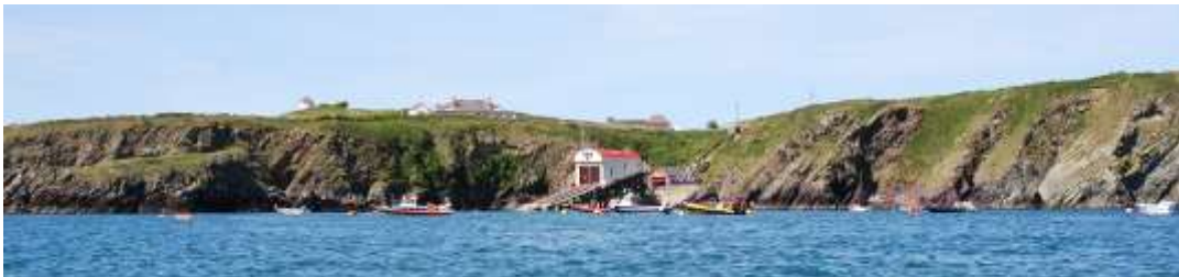
Porthstinan o Swnt Dewi