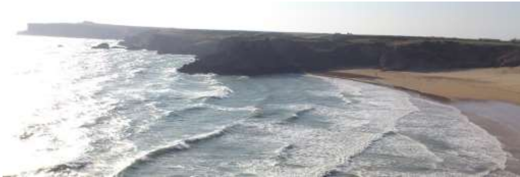
Tonnau yn Aber Llydan