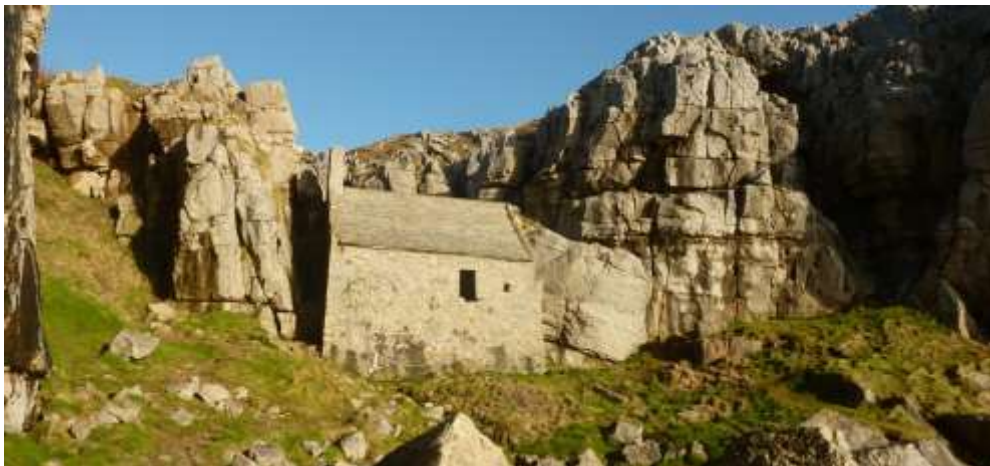
Capel St Gofan