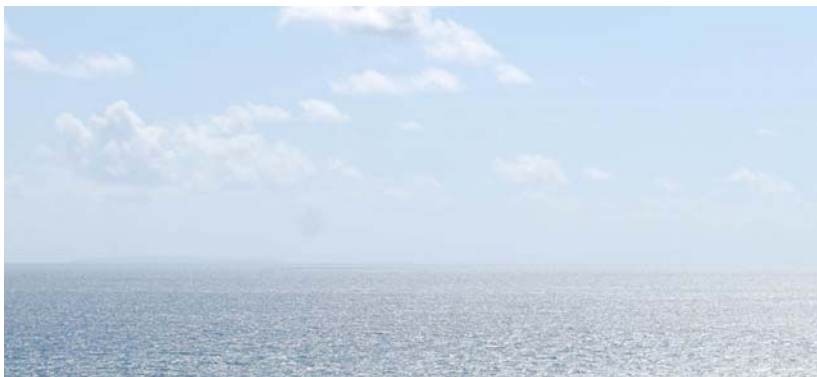
Ardal rhwng yr arfordir ac Ynys Lundy ar y gorwel [i'r chwith] [Golygfa o Benrhyn Gŵyr].