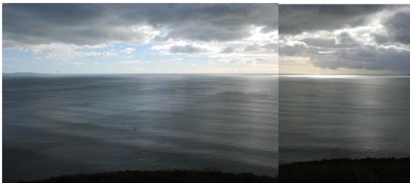
ACM43:Alltraeth Môr Hafren

© Hwylfaint y Gornen a hysbysu cwmni data Ardwg Ordnans / © Crown copyright and database rights Ordnance Survey 100022534, 2020 Sources: Ordnance Survey, Seazone, Pembrokeshire Coast National Park Authority, Natural Resources Wales