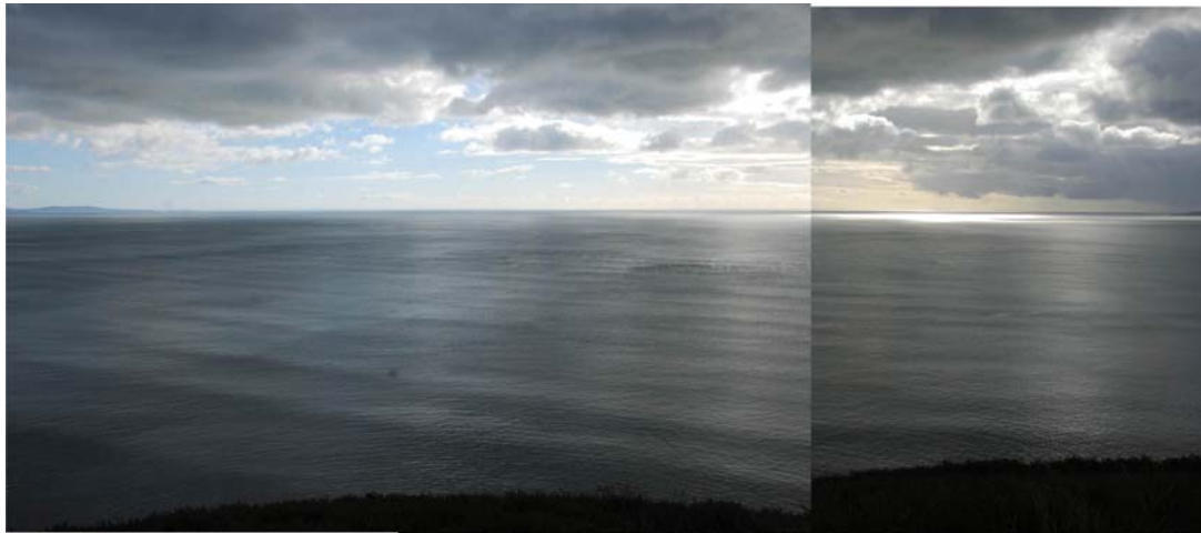
Yr ardal sy'n weladwy o Draeth Pentwyn yn Mae Caerfyrddin - Rhosydd Rhosili yn y Gŵyr i'r dwyrain ac Ynys Bŷr i'r gorllewin [dde]