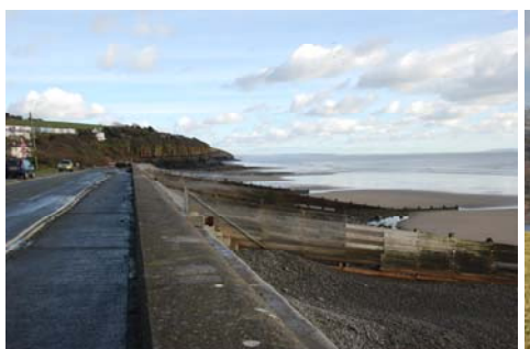
Amroth - morglawdd a grwynau