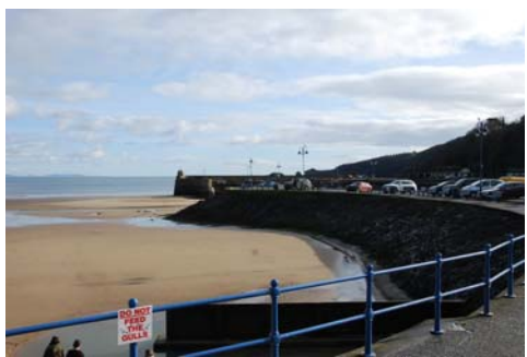
Harbwr a thraeth Saundersfoot