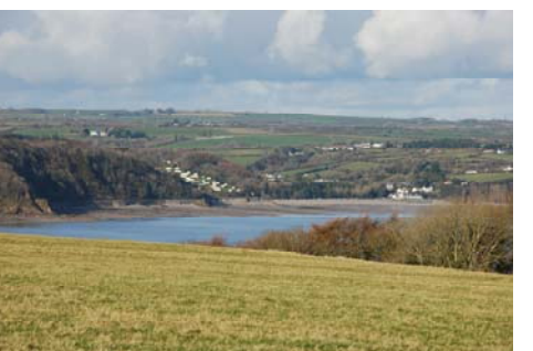
Parciau Carafannau a choetir ar yr arfordir - Wiseman's Bridge