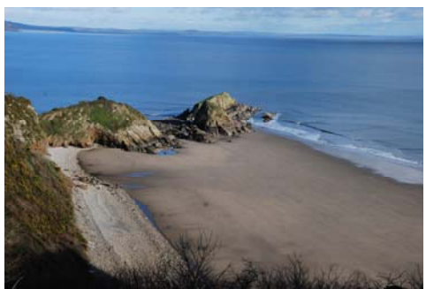
Traeth Monkstone yn darlunio prydferthwch naturiol