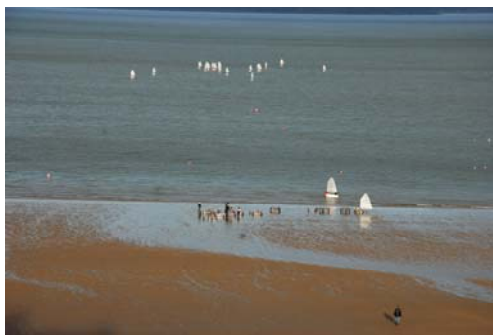
Dinbych y Pysgod- sailing dinghy activity off North Beach