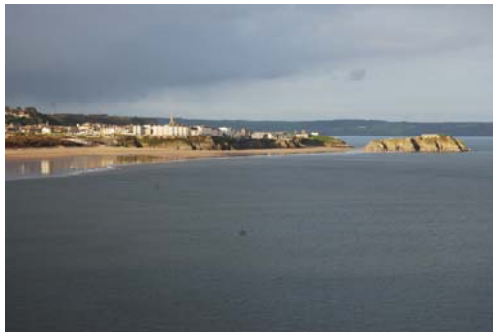
Dinbych y Pysgod a'r meindwr o'r de