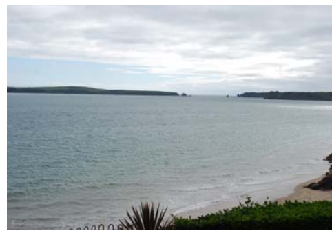
Golwg o Ynys Byr o draeth y De