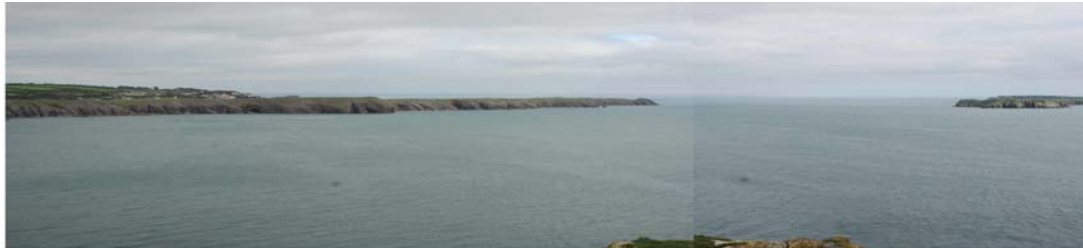
Edrych tua'r dwyrain o Drwyn Lydstep i Swnt Pŷr