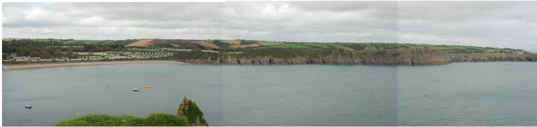
Bae Lydstep o Drwyn Lydstep