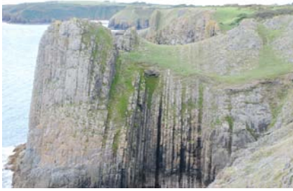
Craig Whitesheet o Drwyn Lydstep yn edrych tua'r gorllewin