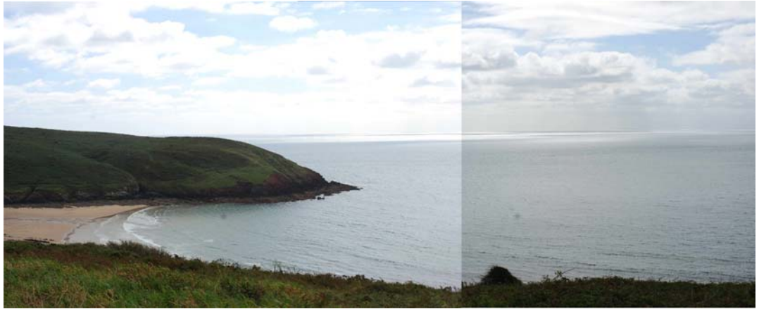
Traeth Maenorbŷr a Thrwyn yr Offeiriad