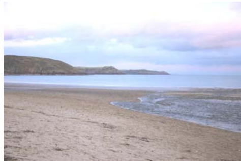
Freshwater East yn edrych tua'r dwyrain