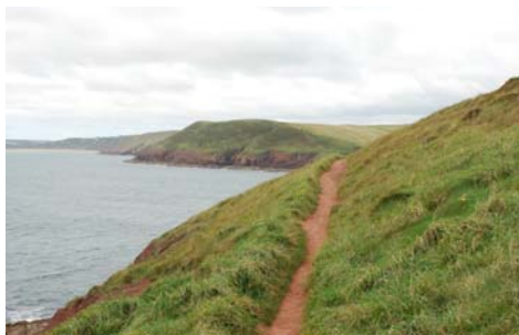
Llwybr v cloewni ar Drwyn yr Offeiriad yn edrych tua'r gorllewin