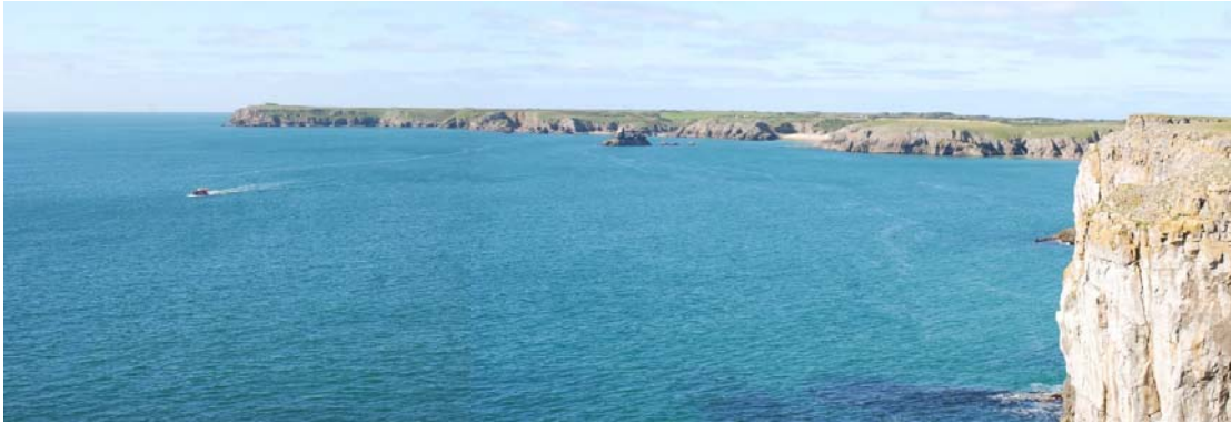
Yr olygfa at Ben Gofan o Benrhyn Ystgabwll