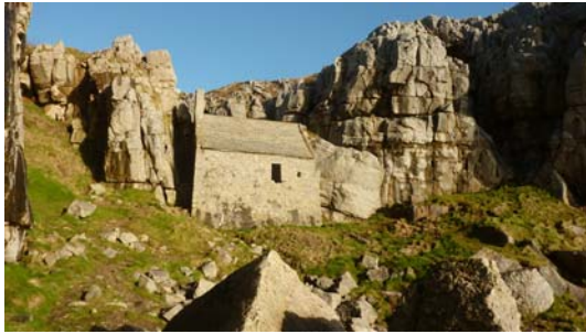
Capel Sain Gofan gyda golygfeydd sianelog allan at y môr