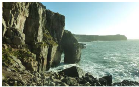
Creigiau a bwâu dan glogwyni calchfaen