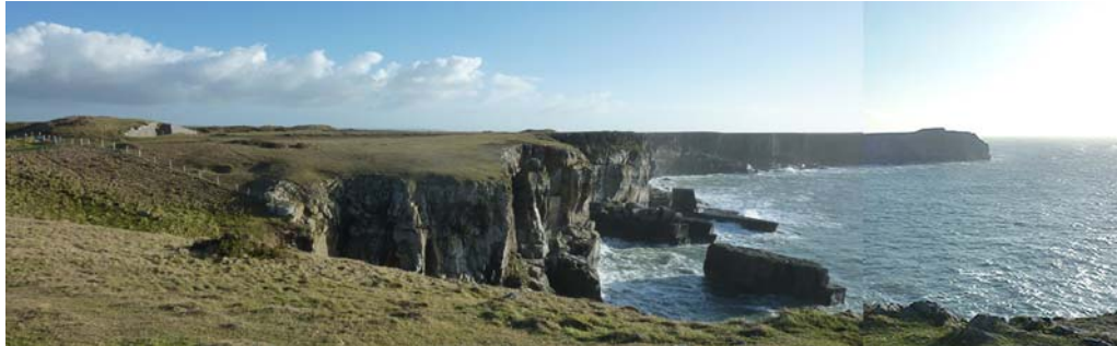
Pen Gofan o'r gorllewin