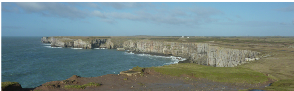
Edrych tua'r gorllewin o Ben Gofan