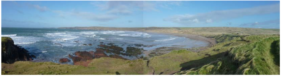
edrych tua'r gogledd ddwyrain o Little Furznip