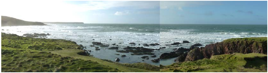
edrych tua'r de o Little Furznip