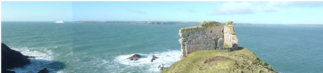
Mouth of Milford Sound from near Rat Island, with ferry off St Ann's Head