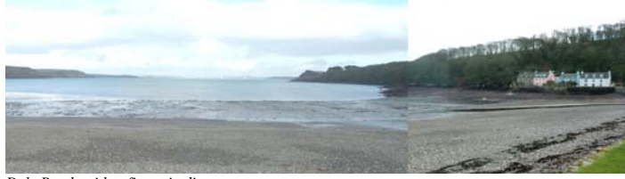
Dale Roads with refinery in distance