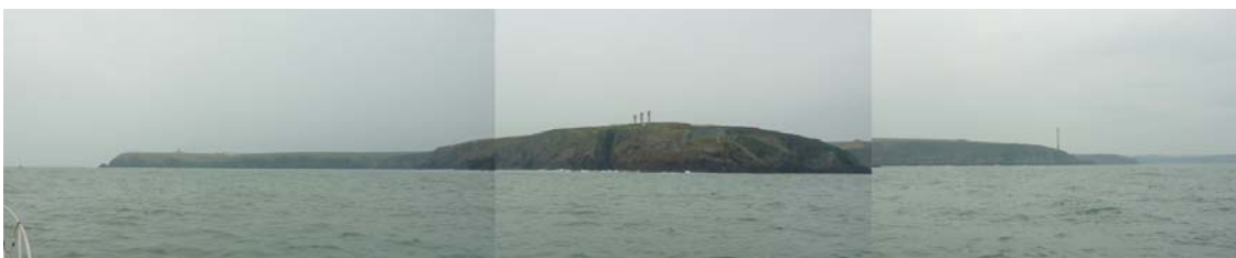
In the mouth of the Sound approx 500m from shore