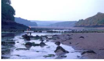
Sandyhaven Pill