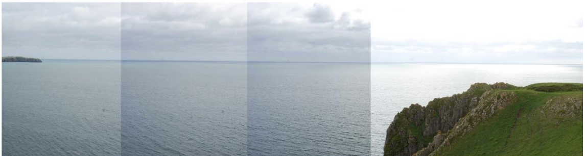
Golygfa dros y môr tuag at y gorwel fel y'i gwelir o Bentir Lydstep, tu hwnt i SCA37