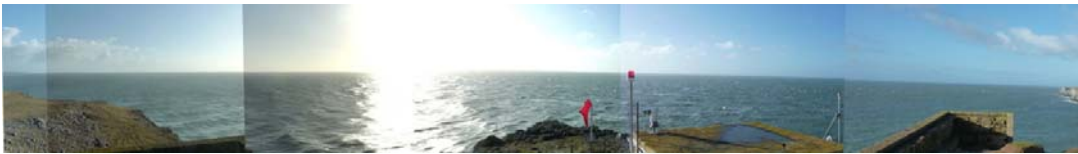
Ardal allan i'r môr o Benrhyn Sant Gofan (yn SCA35)