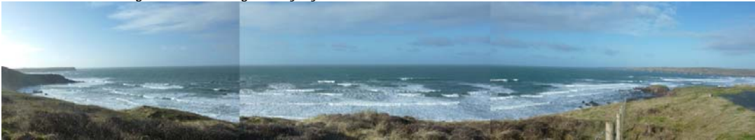
Ardal allan i'r môr o Freshwater West (yn SCA34)