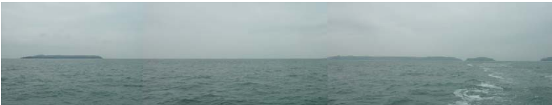
Ardal a welir rhwng Skokholm a Sgomer yn y môr