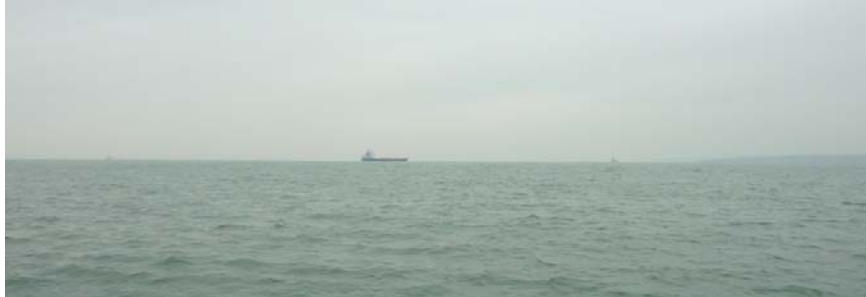
Golwg o'r ardal yn y Môr i'r dwyrain o Sgomer