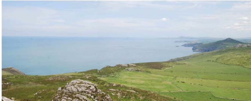
Golwg o gydran ogleddol yr ardal o Garn Llidi gyda SCA13 yn y tir canol