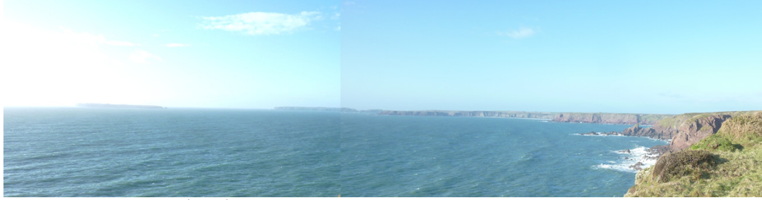
Edrych tua'r dwyrain at Sgogwm (chwith) a phenrhyn Marloes