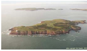
Sgogwm o'r awyr