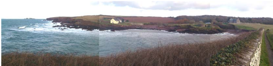
Hafan San Ffraid, Stack Rocks oddi ar y lan yn y pellter