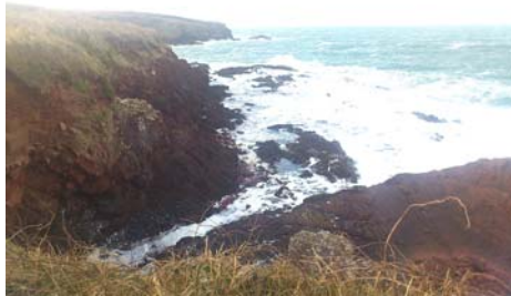
I'r gorllewin tuag at Huntsman's Leap