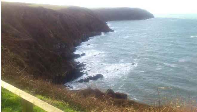
Edrych tua'r gorllewin tuag at Borough Head