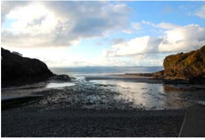
Yr olwafa o Aber Bach ar draws Bae Sain Ffraid