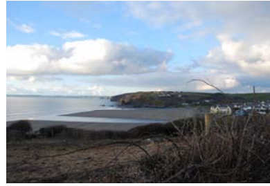
Yr olwafa ar draws traeth Aber Llydan