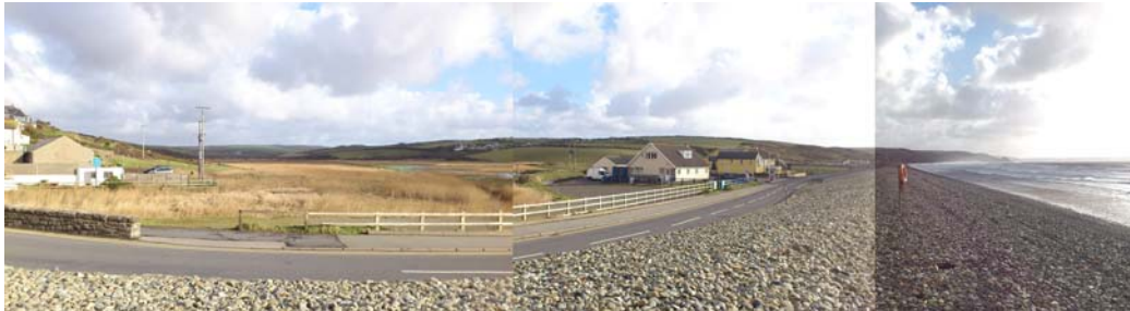
Edruch tua'r de o Niswaul