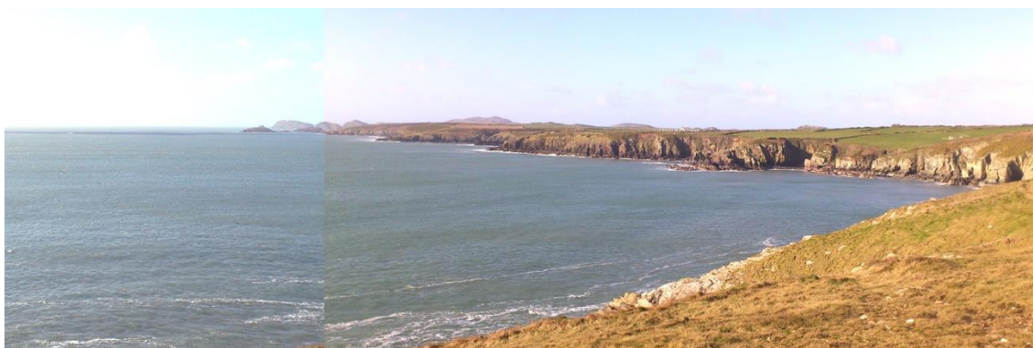
Edrych i'r gorllewin o gerllaw Caerfai i Ynys Dewi yn y pellter