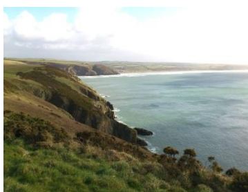
I'r dwyrain o gerllaw i Dinas Fach