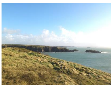
I'r dwyrain o Gaerfai