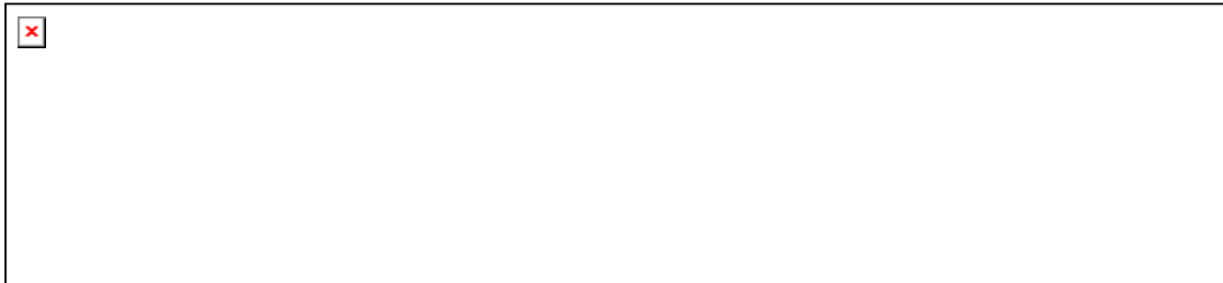
Golygfa o'r Bae ac Ynys Dewi o Garn Llidi