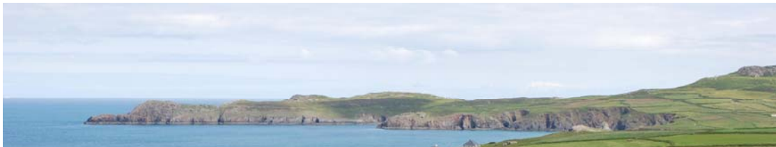
Penmaendewi yn edrych ar draws Y Porth Mawr o Garn Rhosson