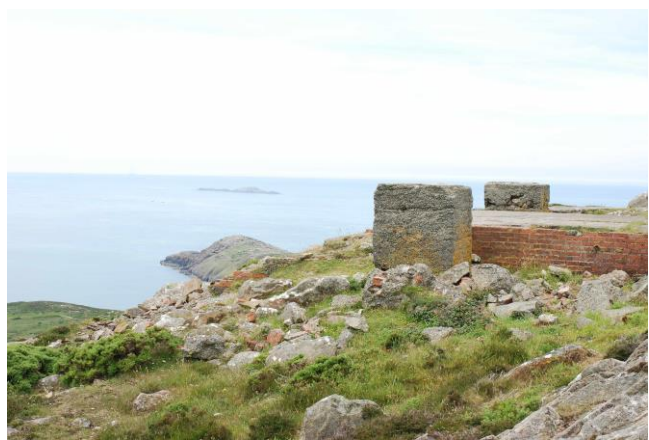
Yr olygfâ tua'r gorllewin o Garn Llidi yn dangos adfeilion o'r Ail Rhyfel Byd