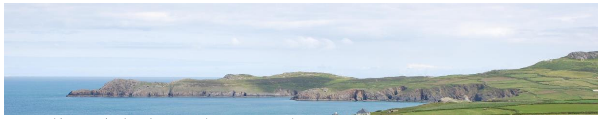
Pentir Tyddewi yn edrych ar draws Traeth Mawr o Garn Rhosson