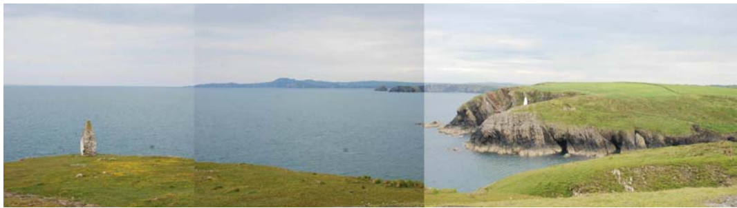
Marcwyr porthladd Porthgain yn edrych tua'r gogledd ddwyrain tuag at Ben-caer