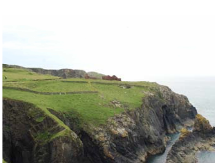
Porth Ffynnon - i'r gorllewin o Borthgain - gydag adeilad y chwarel