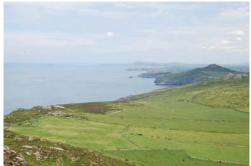
Carn Penberry o Garn Llidi yn edrych tua'r gogledd ddwyrain