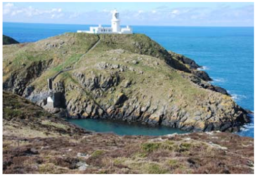
Y môr tu hwnt i oleudy Pen-caer [wedi ei gymryd o SCA 11]