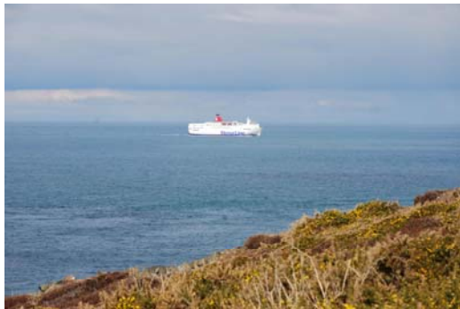
Y môr gyda'r cwch fferi'n gadael yr ardal am ddyfroedd sy'n agosach at Abergwaun