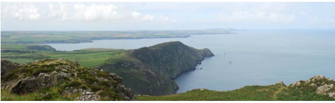
Penbwchdy o Garn Fawr