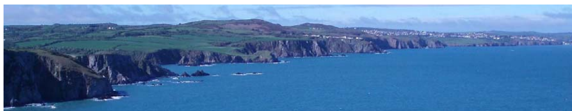
Edrych o Benrhyn Dinas de-orllewin i gyfeiriad Abergwaun