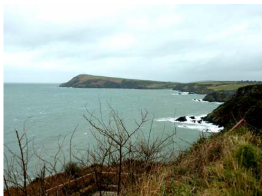
Edrych i'r dwyrain i Benrhyn Dinas o faes carafanau Penrhyn