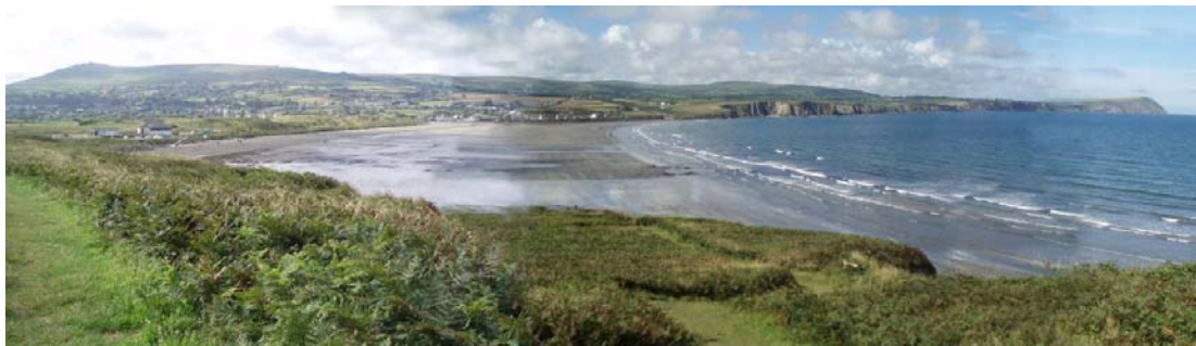
Bae Trefdraeth o Drwyn y Bwa