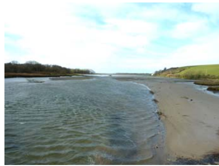
Aber yr afon Nyfer