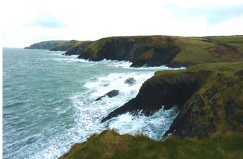
Edrych i'r gogledd ddwyrain o Gareg Wylan