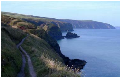
Edrych i gyfeiriad Bae Trefdraeth