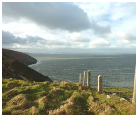
Edrych i'r gorllewin o Benrhyn Cemaes