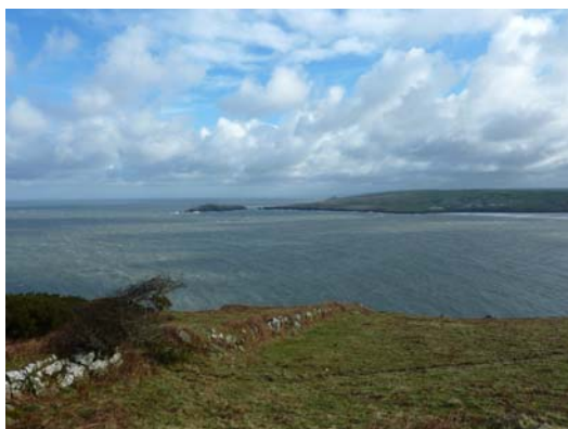
Edrych ar draws y bae tuag at Ynys Aberteifi d