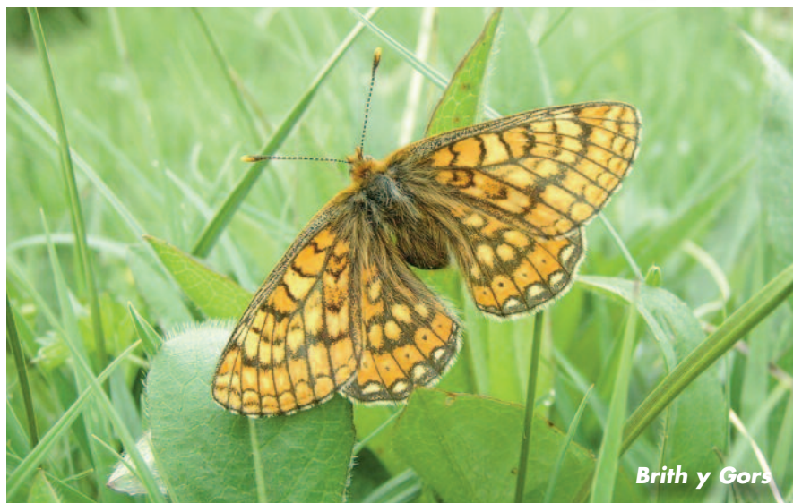
Brith y Gors